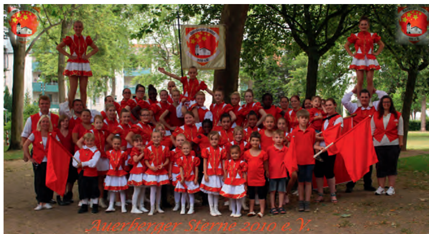
Auerberger Sterne 2010 e.V.